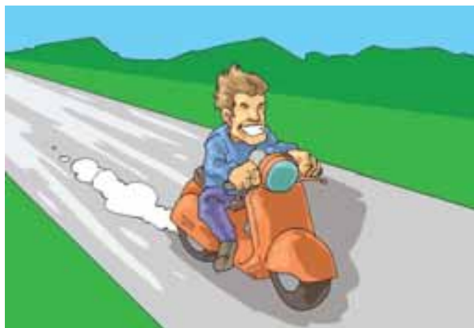
4. Meno indulgenza nei confronti di chi non vuole indossare il casco o lo tiene slacciato...

* Rif. di legge: art. 97 comma 2 del Codice della Strada