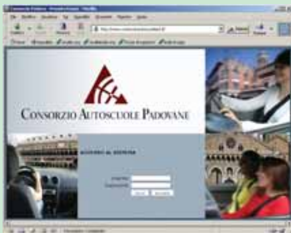
Il consorzio Autoscuole Padovane è il primo ad avere adottato il sistema di prenotazione telematica degli esami con il sito www.conorzioautoscuolepd.it

F orte di 20 anni di esperienza nella produzione di software per il settore trasporti, AutoSoft Multimedia, in collaborazione con il Consorzio Autoscuole Padovane, lo scorso 13 dicembre ha attivato un progetto di supporto alla Motorizzazione Civile di Padova per la prenotazione delle sedute di esame. Il progetto è ancora in fase di collaudo, ma i primi risultati sono altamente positivi e c'è da ritenere che soddisfatti appieno le necessità degli attori in gioco: l'Ufficio Provinciale da una parte, le autoscuole dall'altra. Come sappiamo, allo stato attuale la procedura di prenotazione degli esami è affidata agli Uffici Provinciali che la realizzano manualmente con l'assegnazione delle sedute e dei posti. I criteri utilizzati sono vari e dipendono dalla situazione territoriale. Comunque le autoscuole per prenotare gli esami si devono recare "personalmente" presso gli sportelli dell'Ufficio Provinciale. Gli Uffici Provinciali hanno molte difficoltà nella gestione manuale di questa complessa procedura dove le difficoltà iniziano, ad esempio, nello stabilire ogni mese quante e quali sedute sarà necessario predisporre. A ciò si aggiungono