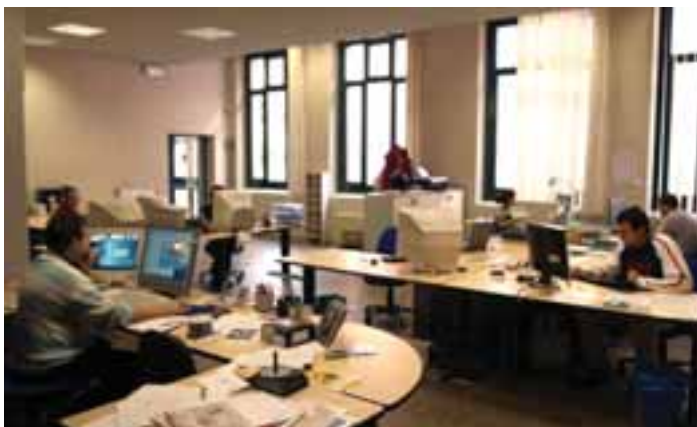
L'Ufficio Ricerca e Sviluppo di SIDA by AutoSoft a Luino (VA)

Il connubio tra queste due realtà era cosa naturale e non si è fatto attendere. Le due aziende hanno deciso di unire le forze per proporre su tutto il mercato un idoneo pacchetto con agevolazioni per le autoscuole che vorranno affrontare questo nuovo fenomeno. E' probabile, infatti, che gli esami ai terminali comporteranno per le scuole guida un impegno finanziario con la contropartita, però, di limitare il