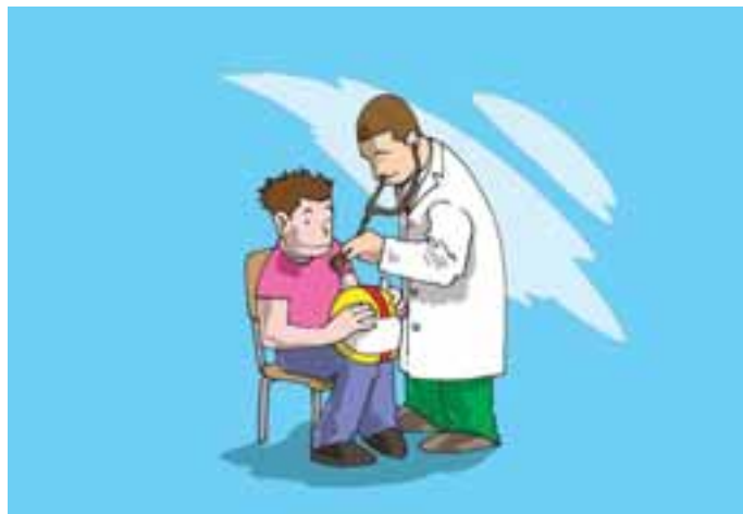
1. Tutti i candidati al patentino devono effettuare una visita medica..

* Rif. di legge: art. 116 comma 1 quinquies del Codice della Strada