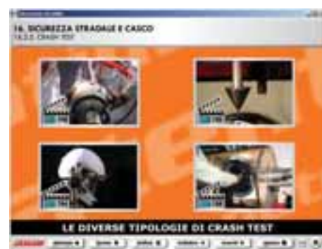
Il nuovo Easy Edu 2 contiene anche una sezione di educazione stradale che contiene filmati e animazioni che possono facilmente intrattenere i meno giovani.