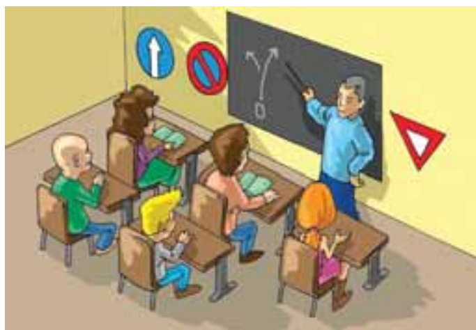
2. ...e frequentare un corso di formazione.