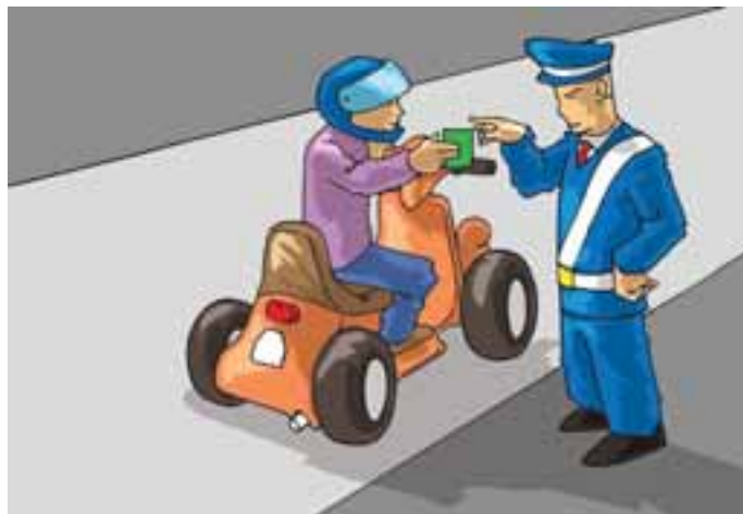
3. Il patentino è come una patente normale: va portata sempre con sé e va esibita agli agenti di polizia.