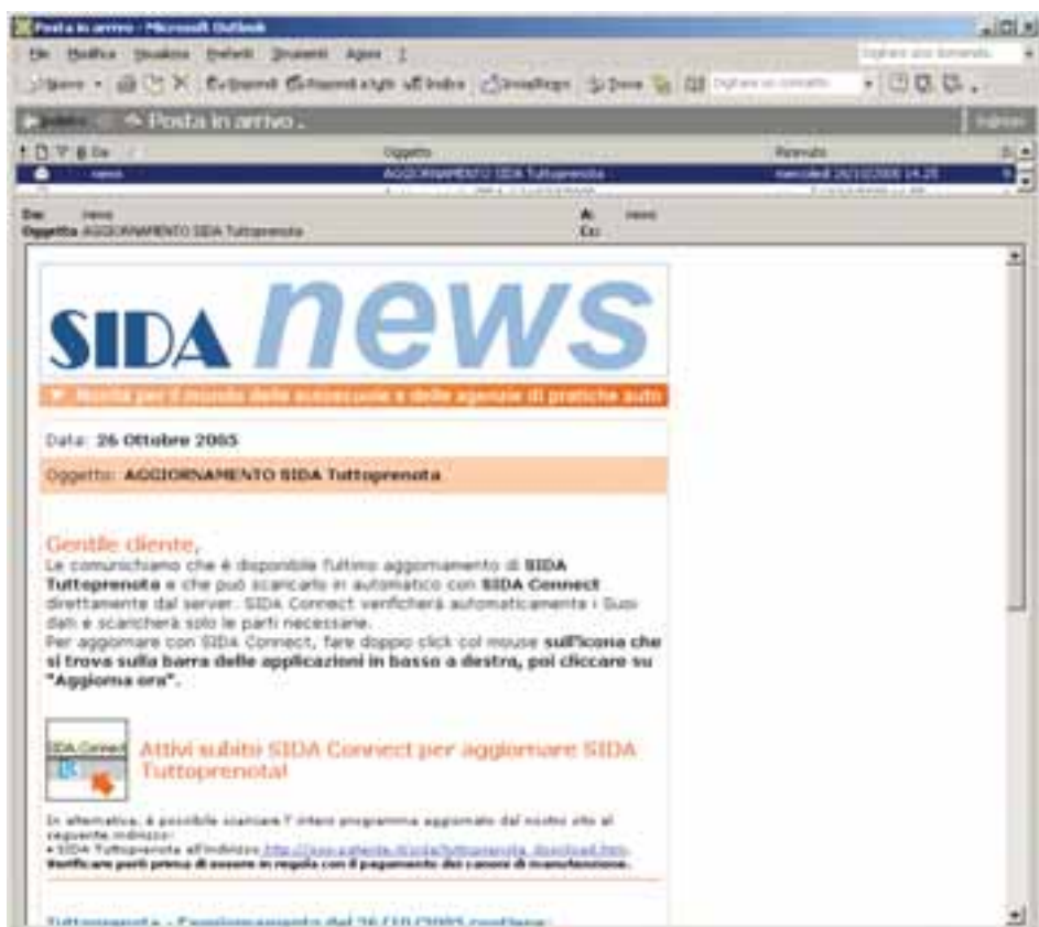
Chi ha una casella di posta elettronica può ricevere gratuitamente gli avvisi di aggiornamento dei software e le informazioni più urgenti.

Gli affezionati di Internet sanno bene che cos'è una newsletter: è una mail che viene spedita periodicamente da aziende, enti o associazioni per informare tutti gli utenti che ci sono novità interessanti per loro. Anche noi di SIDA abbiamo deciso di sfruttare questo strumento per avvisare tutti i clienti che possiedono i nostri software quando sono disponibili aggiornamenti o patch da scaricare, o quando sul sito abbiamo pubblicato delle circolari di particolare interesse per il loro lavoro. Specialmente gli utilizzatori di Tuttopenota sanno bene che al DTT le procedure per trasmettere le pratiche sono soggette a molti cambiamenti, ragione per cui è diventato un imperativo assoluto aggiornare il software in tempo reale per non restare indietro con il lavoro. Anche per i programmi dell'Aula, della Gestione e dei Quiz si rende necessario periodicamente un aggiornamento – al di là di quello “ufficiale” distribuito anche con i cd per posta – non perché ci siano errori da correggere, ma perché le leggi e le norme del codice stradale cambiano molto spesso. La nostra newsletter avvisa dunque quando ci sono aggiornamenti da installare: cosa bisogna fare in concreto? Nient'altro che attivare SIDA Connect, che preleva dal server i file nuovi e li installa sul computer in automatico. Nel funzionamento, è molto simile a Windows Update, il sistema adottato da Microsoft, con la differenza che