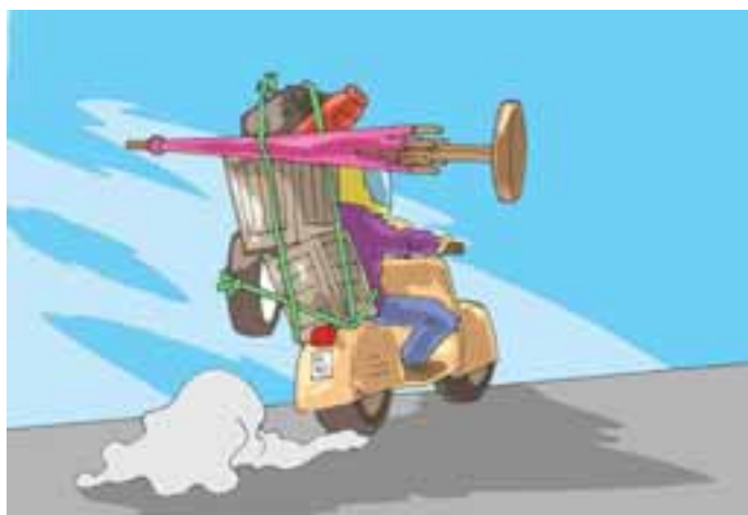
6. ...e sistema male il carico compromettendo la sicurezza della guida...