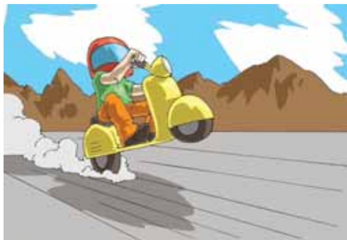
5. ...e di chi si ostina a credere che la strada sia una pista motociclistica e si cimenta in acrobazie e impennate...