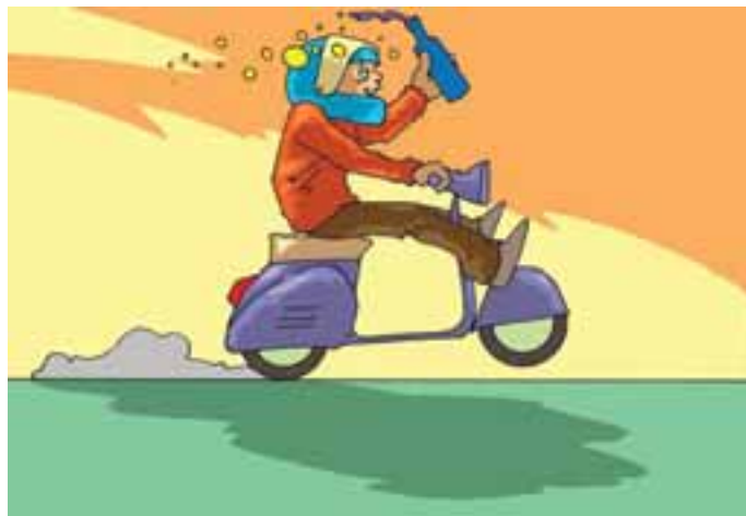
9. ...oppure in stato di ebbrezza..