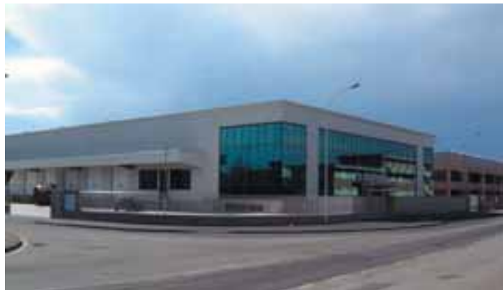
La sede operativa di Elettrodata a Peschiera Borromeo (MI)

un'aula informatizzata idonea all'attuale orientamento del Ministero allestendo un'aula simile a quelle degli uffici provinciali devono pensare realisticamente che sosterranno un costo pari a quello di una vettura per le guide (ossia una spesa che ogni scuola affronta quasi annualmente e quindi non proibitiva).