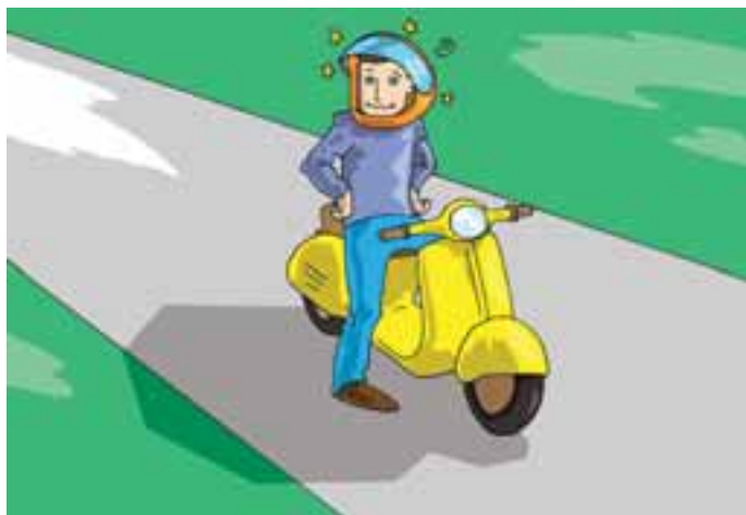
8. ...è prevista la sospensione del patentino per chi circola sotto l'effetto degli stupefacenti..

La domanda da presentare all'Ufficio provinciale per ottenere il rilascio senza esame del suddetto documento può essere redatta anche utilizzando il modello 2112 MEC, in tal caso, in corrispondenza della casella "patente richiesta", l'interessato dovrà scrivere la sigla "CIGC". Il certificato medico che gli interessati devono produrre deve essere in bollo, come prescritto dalle vigenti norme in materia fiscale e deve contenere la fotografia del richiedente.