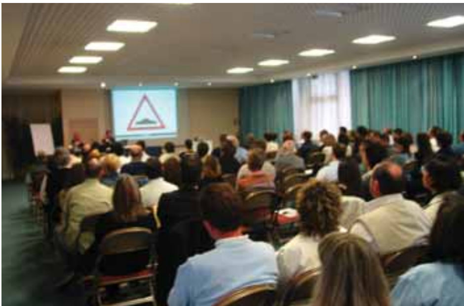
Un momento dell'edizione precedente del seminario SIDA di Milano.

In Motorizzazione le bocche sono cucite, anche se i più curiosi già avranno notato che si è provveduto, in molti Uffici Provinciali, ad allestire nuove aule informatiche. Per questo motivo SIDA, basandosi su un'esperienza di ben venti anni sui quiz informatizzati, e potendo contare su una conoscenza profonda del settore e delle sue dinamiche interne, può soddisfare molte delle curiosità delle scuole guida e rispondere agli innumerevoli interrogativi che si sono poste. Nell'occasione verrà anche presentato il nuovo Quiz Millennium, il software che contiene già le maschere e la grafica dei quiz ufficiali.