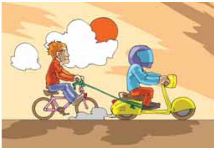
7. ...e traina altri veicoli come biciclette, motorini, ecc...