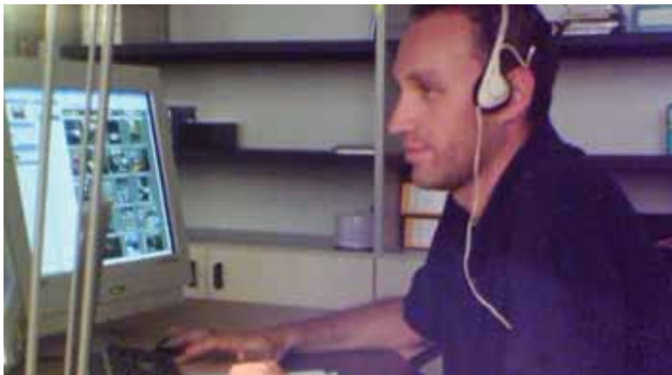
Lo staff tecnico di SIDA by AutoSoft si compone di personale specializzato sia dal punto di vista hardware che software.

La Motorizzazione sta per dare il via ai quiz al computer, e presto sarà la volta delle autoscuole. Per questo motivo, SIDA ha allacciato un sistema di partnership con dei centri di assistenza tecnica per offrire un servizio chiavi-in-mano a tutte le autoscuole che non vogliono lasciarsi sfuggire la possibilità di ospitare gli esami in sede. Questi centri servizi opereranno in sintonia con gli uffici centrali di SIDA per fornire assistenza hardware e software rispettando determinati standard qualitativi. SIDA seguirà i centri servizi nell'allestimento delle aule informatizzate dal punto di vista tecnico e normativo.